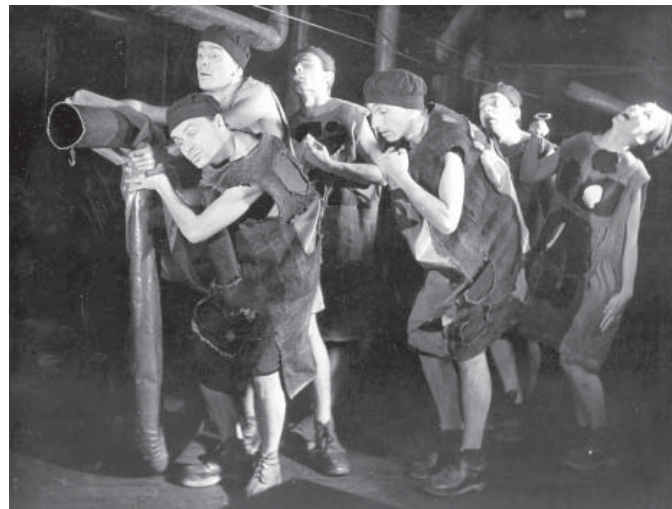
Teatre Laboratori de les 13 files, Akropolis, Opole 1962.